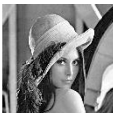
Gambar 1. Citra lena.bmp

Semua tabel dan gambar yang Anda masukkan dalam dokumen harus disesuaikan dengan ukuran 1 kolom atau ukuran penuh satu kertas, agar memudahkan bagi reviewer untuk mencermati makna gambar.